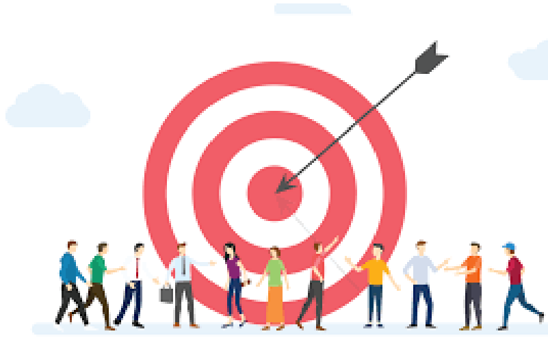
Tablo 1 STRATEJİK PLAN GELİŞTİRME KURULU

Stratejik Plan hazırlık çalışmalarını takip etmek ve ekiplerden bilgi alarak çalışmalarını yönlendirmek, koordine edilmek, resmi yazışmaları yapmak, gerektiğinde danışmanlık hizmeti toplantılarının organizasyonu yapmak, okul içi ve dışı iletişimin sağlanmak gibi destek hizmetlerinin yerine getirilmesi, sürecin ana aşamalarını ve çıktılarını kontrol ederek, çalışanların stratejik planlama sürecine aktif katılımını sağlayarak, tartışmalı hususları görüşüp karara bağlama işlemlerini gerçekleştirmek üzere Tablo 1’de yer alan kişilerden teşekkül etmektedir.